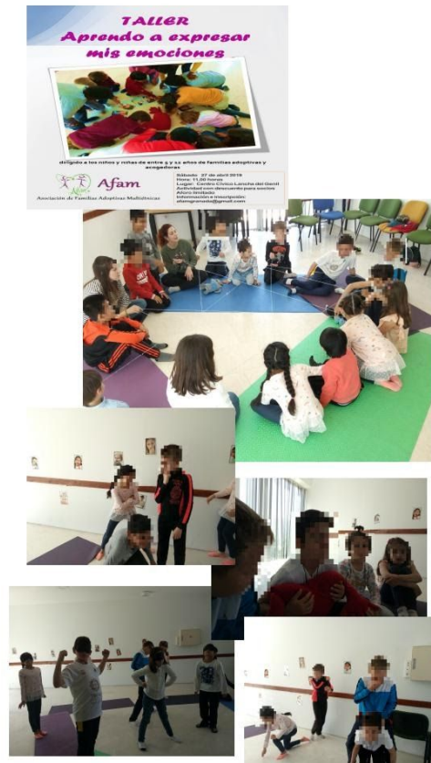
Actividad realizada el 27/04/2019